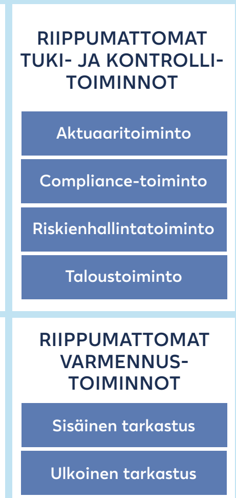
Riskienhallinnan ja vakavaraisuuden hallinnan organisointi

tuntijaelin, ja se raportoi suoraan hallitukselle. Komitea vastaa siitä, että taseriskien hallinta on järjestetty asianmukaisesti ja pääomat ovat tehokkaassa käytössä. Hallitus nimittää sijoitustoiminnan johtoryhmän, joka vastaa sijoitustoiminnan käytännön organisoinnista.